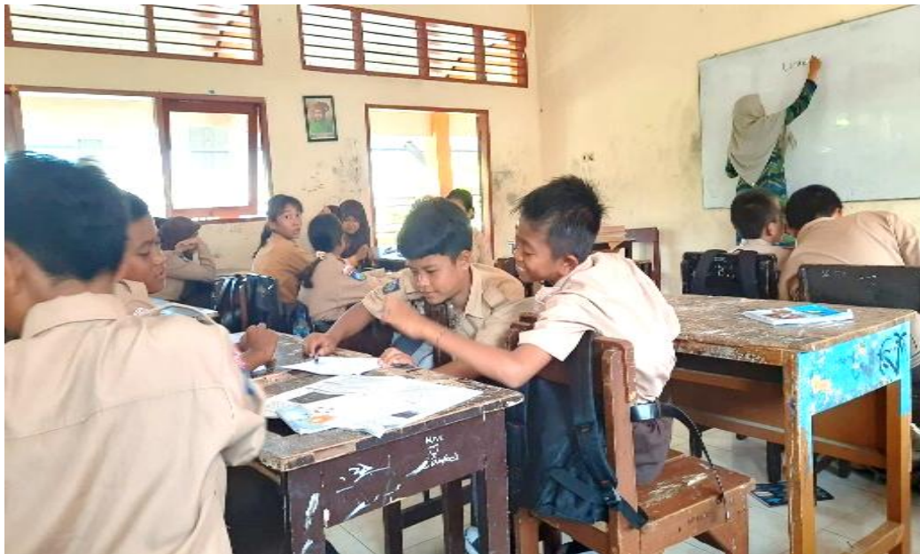
Gambar 1. Kegiatan Pembelajaran di dalam kelas

diminta untuk menulis tiga hal penting. Pertama, dia harus memahami materi dalam bahasa Siwa sendiri. Kedua, dia harus menceritakan perasaannya selama proses belajar. Ketiga, sikap apa pun yang dimiliki siswa membuat pembelajaran bermakna bagi mereka. Gambar berikut menunjukkan proses pembelajaran.