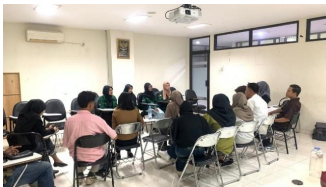
Gambar 1. Observasi Awal

Tahapan awal dalam kegiatan pengabdian ini dimulai dengan observasi oleh Tim NutriPie Okra Bliss dengan melakukan diskusi dan pengamatan terlebih dahulu untuk memahami kebutuhan mahasiswa dalam pengembangan berwirausaha. Observasi ini bertujuan untuk memetakan sejauh mana pengalaman mahasiswa dalam mengikuti Program Pembinaan Mahasiswa Wirausaha (P2MW) serta mengidentifikasi kesenjangan pemahaman yang masih dihadapi oleh mahasiswa. Berdasarkan diskusi awal dan hasil observasi menunjukkan bahwa sebagian besar dari para mahasiswa sudah memahami bahkan memiliki minat untuk berwirausaha, hanya saja masih sangat membutuhkan pemahaman lebih dalam tentang bagaimana cara menyusun proposal P2MW, strategi yang tepat untuk membangun usaha, serta pentingnya membentuk sebuah tim yang solid. Hasil temuan ini menunjukkan bahwa adanya kebutuhan signifikan terhadap kegiatan pembinaan dan juga pelatihan kewirausahaan yang tidak hanya bersifat konseptual, tetapi juga dapat memberikan pengalaman secara langsung dan penjelasan yang praktis. Sejalan dengan temuan Silamat et al., 2025, bahwa pelatihan kewirausahaan penting karena mahasiswa tidak hanya memperoleh teori saja melainkan dapat memperoleh peluang untuk mengimplementasikan ide bisnis.