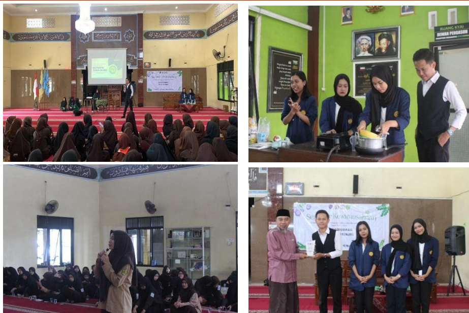
Gambar 4. Tahap Pelaksanaan Penyampaian Materi, Demonstrasi, Diskusi Tanya Jawab dan Penyerahan Penghargaan

Evaluasi dilakukan selama pelaksanaan seminar berlangsung maupun setelah seminar selesai dengan menggunakan kuesioner kepuasan peserta dan pengamatan secara langsung terhadap partisipasi mahasiswa selamat proses pembelajaran. Tujuan dilakukan evaluasi ini adalah untuk melihat atau mengetahui sejauh mana materi kewirausahaan yang disampaikan, studi kasus usaha Nutripie Okra Bliss, dan juga demonstrasi pembuatan fla pie dapat dicerna dan dimengerti oleh mahasiswa. Antusias yang tinggi juga ditunjukkan oleh mahasiswa selama kegiatan berlangsung, terlihat dari keaktifan mereka dalam mengikuti sesi penyampaian materi, demonstrasi pembuatan fla pie, maupun diskusi dan tanya jawab.