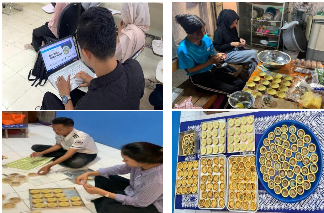
Gambar 2. Tahap Persiapan Penyusunan Materi dan Pembuatan Produk

pengalaman memungkinkan peserta memperoleh pemahaman yang lebih bermakna melalui keterlibatan langsung dalam proses dan praktik kewirausahaan. Tim juga menyiapkan 200 pieces pie agar mahasiswa dapat merasakan produk dari Nutripie Okra Bliss secara langsung, ini juga sebagai bentuk pembelajaran praktis karena mahasiswa dapat melihat proses secara langsung melalui demonstrasi dan merasakan hasilnya melalui produk pie tersebut, sehingga mendorong jiwa kewirausahaan mahasiswa.