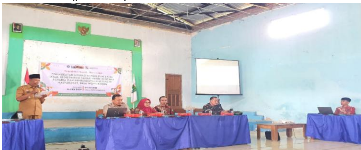
Gambar 2. Kegiatan Penyuluhan Hukum Agraria

Secara teoritis, hukum agraria tidak hanya dipahami sebagai norma tertulis ( law in books ), tetapi juga sebagai praktik sosial ( law in action ). Hasil penelitian menunjukkan adanya kesenjangan antara keduanya sebelum dilakukan penyuluhan. Melalui kegiatan penyuluhan, terjadi transformasi signifikan yang ditandai dengan meningkatnya pemahaman masyarakat serta perubahan perilaku dalam pengelolaan tanah. Penyuluhan hukum berperan sebagai instrumen yang menjembatani kesenjangan tersebut. Pendekatan partisipatif terbukti efektif karena melibatkan masyarakat secara aktif dalam proses pembelajaran. Metode diskusi dan studi kasus memungkinkan masyarakat memahami hukum secara kontekstual.