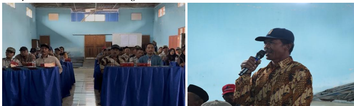
Gambar 3. Interaksi Penyuluhan dan Diskusi Kelompok

Penyuluhan hukum tidak hanya berfungsi sebagai sarana transfer pengetahuan, tetapi juga sebagai media transformasi sosial. Kesadaran hukum kolektif terbentuk melalui interaksi sosial yang intensif selama kegiatan berlangsung. Hal ini sejalan dengan teori kesadaran hukum yang menyatakan bahwa pemahaman, sikap, dan perilaku hukum merupakan satu kesatuan yang tidak terpisahkan (Soekanto, 1983). Selain itu, Friedman (1975) juga menekankan pentingnya budaya hukum dalam mendukung efektivitas sistem hukum.